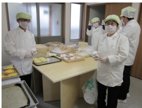
作業室での作業風景